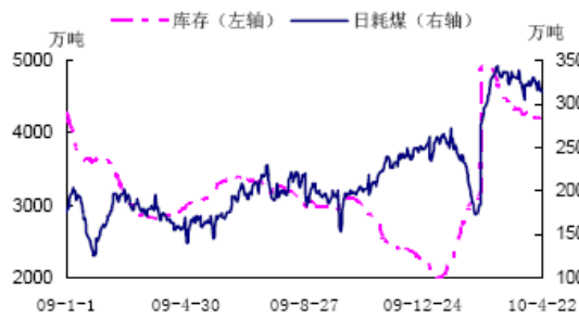
全国重点发电企业存煤、耗煤示意图